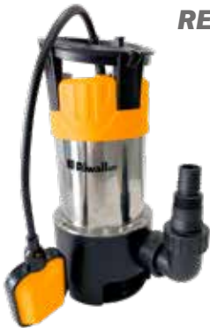
REP 1100 INOX Riwall univerzális búvár szennyvízszivattyú 1100 W