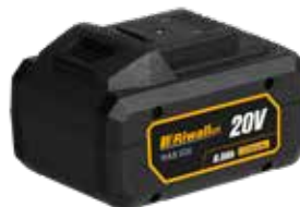
RAB 820 Riwall 20 V Li-Ion akkumulátor 8 Ah