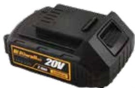
RAB 220 Riwall 20 V Li-Ion akkumulátor 2 Ah