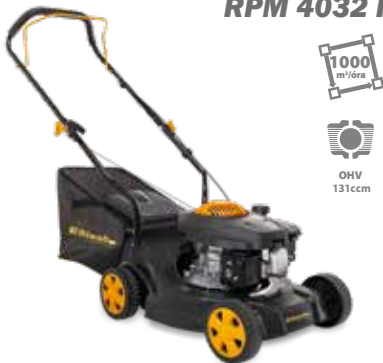
RPM 4032 P