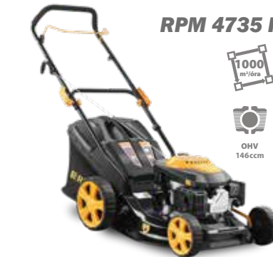
RPM 4735 P