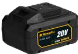
RAB 420 Riwall 20 V Li-Ion akkumulátor 4 Ah