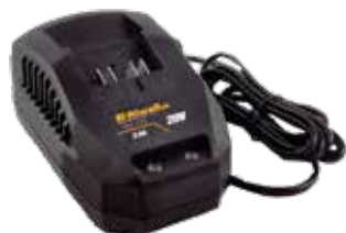
RAC 220 Riwall 20 V töltő 2,4 A