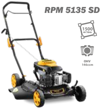
RPM 5135 SD