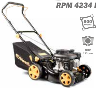
RPM 4234 P