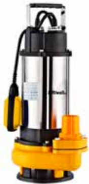
RESP 750 INOX Riwall szabad átömlésű szennyvízszivattyú 750 W