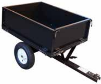
RDC 225 T