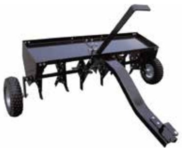
RPA 102 T