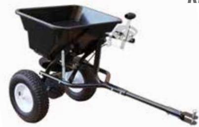
RBS 36 T