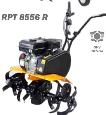
RPT 8556 R