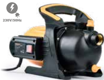
REJP 1200 Riwall kerti szivattyú 1200 W