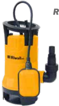
REP 750 Riwall univerzális búvár szennyvízszivattyú 750 W