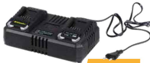
RAC 420 TWIN Riwall 20 V dupla gyorsöltő 4,5 A