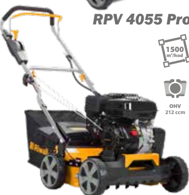
RPV 4055 Pro