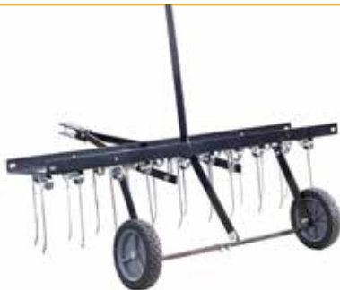
RDT 102 T